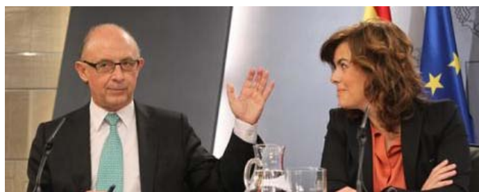
El ministro de Hacienda, Cristóbal Montoro, y la vicepresidenta, Soraya Saénz de Santamaría durante una rueda de prensa tras el Consejo de Ministros... - Pablo Monge

Me gusta 214 | Twitter 222 | Share 30 | +1 3 | Comentarios 18